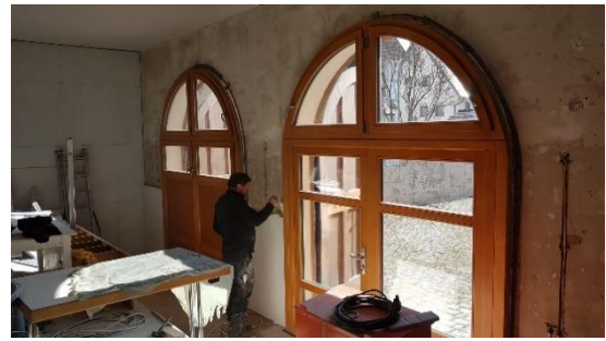
Die neuen Fenstertüren lassen Licht rein!

Ihr merkt – die Bauphase nähert sich langsam dem Ende und wir danken an dieser Stelle schon mal allen, die sich ehrenamtlich mit viel Kompetenz, Zeit und Herzblut seit Wochen engagieren!