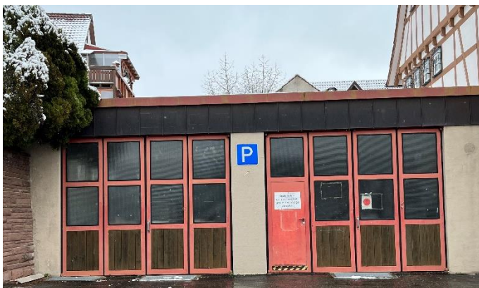
Oktober 22: Die alten Tore