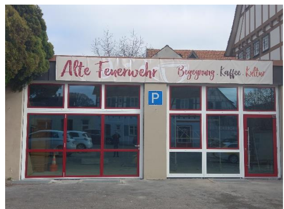
Februar 23: Neue Einblicke sind möglich