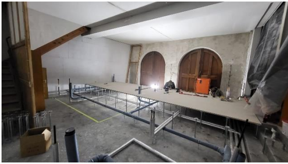
Der Küchenboden wird angehoben, im Hintergrund die alten Tore