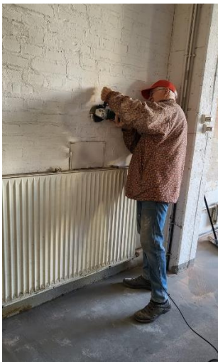
Die Wand zum Rathaus im Oktober 22 Sorgfältiges Schleifen!

Zuerst wollen wir euch einige Bilder vom Baufortschritt zeigen: